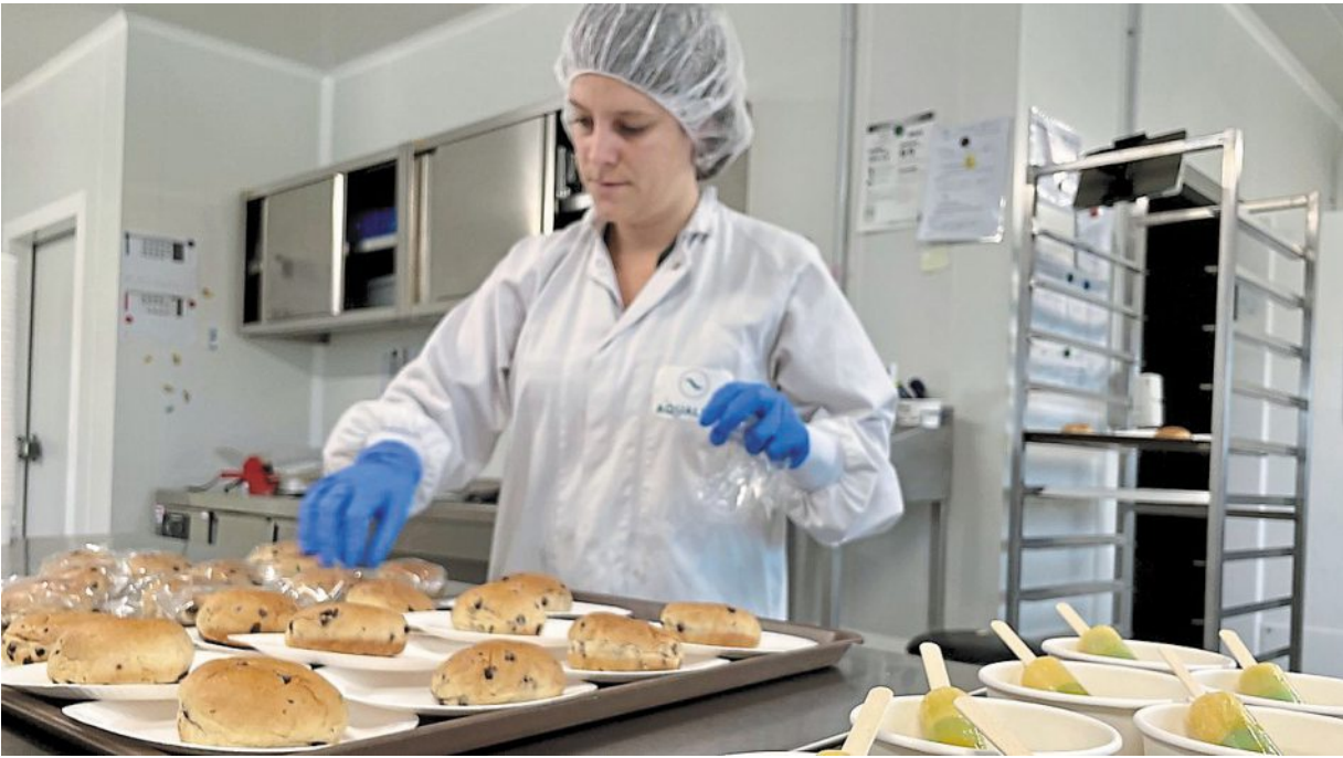
La société Aqualeha est spécialisée dans les tests de produits de consommation : alimentation, cosmétique, produits d'entretien et alimentation animale.

« On accueille des nouvelles personnes toute l'année », sourit la responsable. Les testeurs peuvent avoir « de 7 à 99 ans » : « un fabricant de